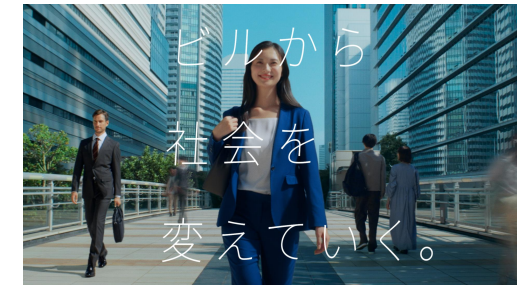
日立ビルシステム 「ビルから社会を変えていく。」