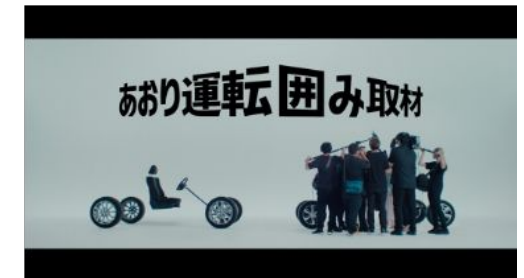
トヨタ自動車 SDGs施策ムービー あおり運転困み取材