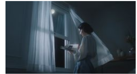
ボシュロム 瞳と向き合ってJ50年。